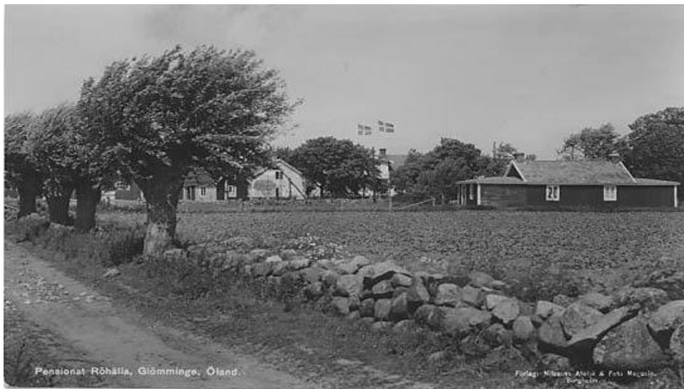
Vägen ner mot Röhälla.