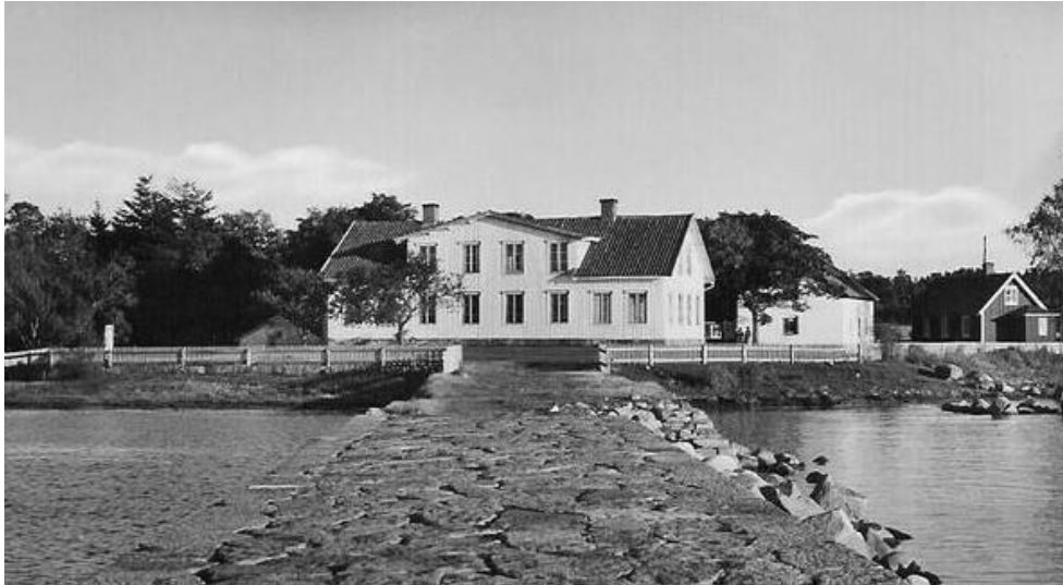
Röhälla från sjösidan.