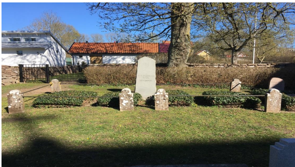
Familjegraven på Glömminge kyrkogård.